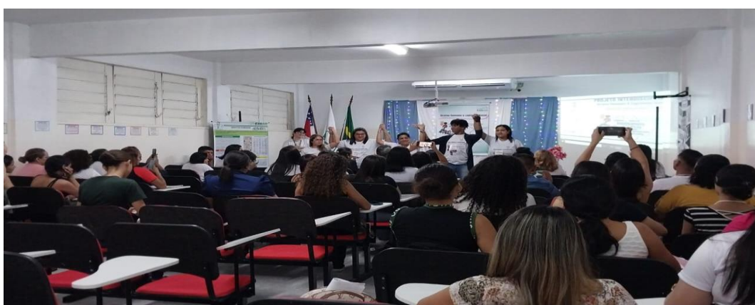
Mesa com palestrantes